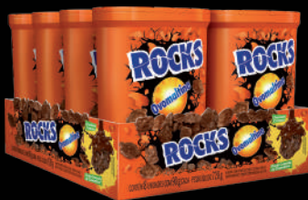
Contém 8 unidades com 90g cada.