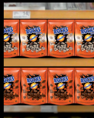
Fica em pé na gôndola.