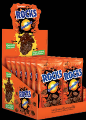
Contém 18 unidades com 40g cada.

Volume alto, visibilidade, preço competitivo